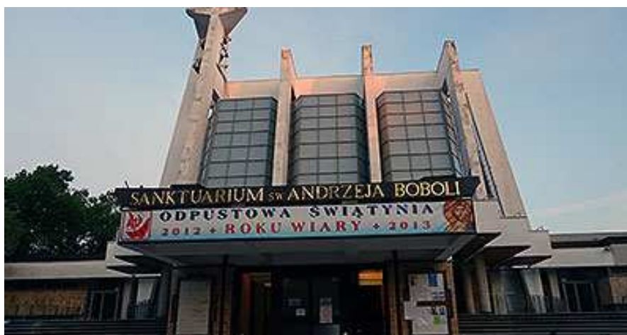
Sanktuarium Św. Andrzeja Boboli na Warszawskim Mokotowie