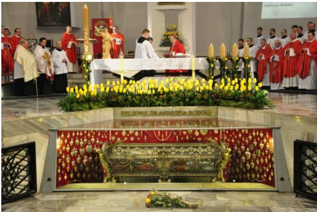
Warszawa – 17. IV.2013 r - 75-Lecie Kanonizacji Św. Andrzeja Boboli