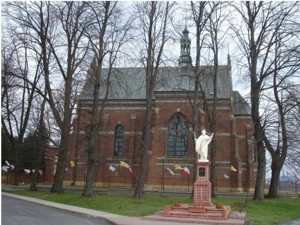
Sanktuarium Św. Andrzeja Boboli w Strachocinie