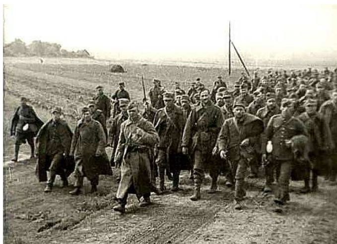
Polscy żołnierze - jeńcy wojenni konwojowani przez Armię Czerwoną